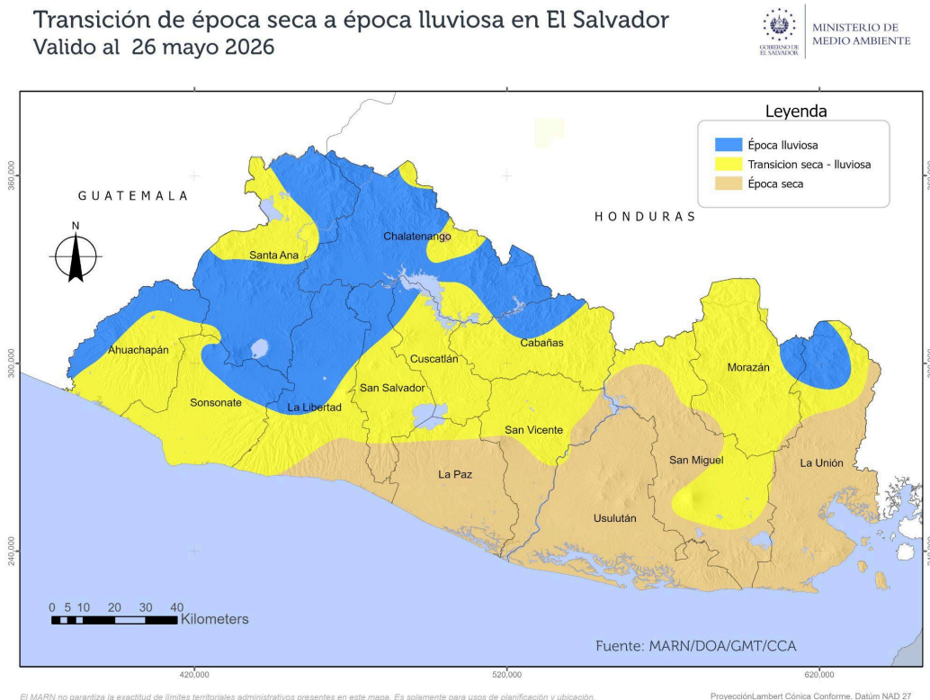
Figura 1. Mapa de zonas que ya se encuentran en época lluviosa en El Salvador 2026.

Durante los primeros días de mayo se han registrado lluvias más regulares en algunas zonas del país. En varias estaciones, las cantidades de precipitación acumulada ya han alcanzado los umbrales establecidos, por lo que estas áreas ya se encuentran en época lluviosa. En cambio, otras estaciones aún permanecen en transición de la época seca a la lluviosa, debido a que todavía no han alcanzado dichos umbrales (Figura 1).